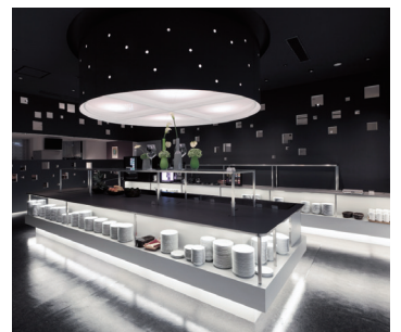
レストラン・フィオーレ