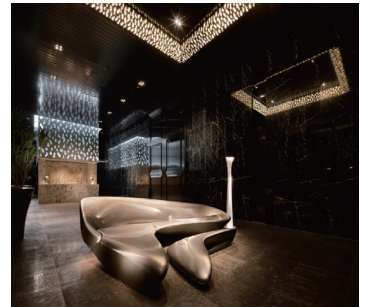
THE ROPPONGI TOKYO