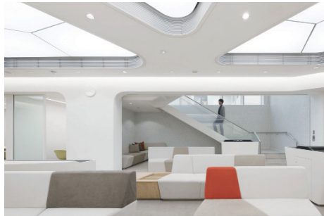
三井住友銀行 夙川支店