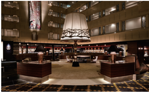
京都センチュリーホテル