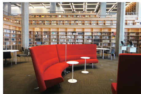
東京理科大学葛飾キャンパス 図書館