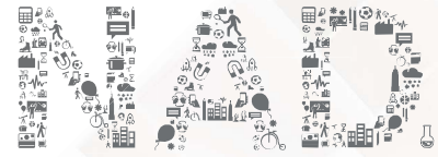
NIKKEN ACTIVITY DESIGN Lab

日建設計は、建築の設計監理、都市デザインおよびこれらに関連する調査・企画・コンサルティング業務を行うプロフェッショナル・サービス・ファームです。「価値ある仕事によって社会に貢献する」という基本理念を尊重し、1900年の創業以来120年にわたって、社会の要請とクライアントの皆様の様々なご要望にお応えすべく、顕在的・潜在的な社会課題に対して解決を図る「社会環境デザイン」を通じた価値創造に取り組んでいます。