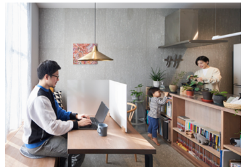
在宅勤務で子どもと一緒に過ごす