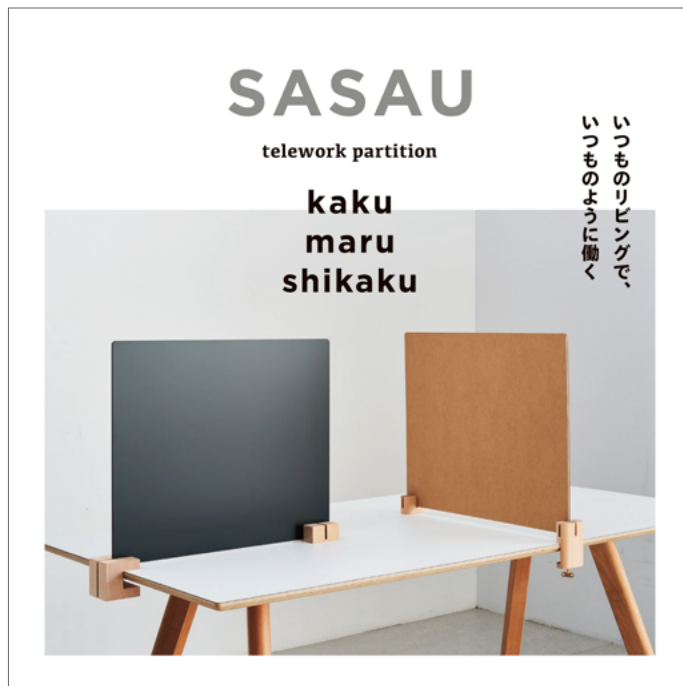
在宅勤務を支援する卓上パーティション kaku / maru / shikaku

株式会社日建設計（本社：東京都千代田区 代表取締役社長：大松敦）で社会と個人をアクティブにする越境デザイン集団・NAD (NIKKEN ACTIVITY DESIGN lab) は、ハンガーをはじめとしたアパレル関連製品を手掛ける日本コパック株式会社（以下COPACK）（本社：東京都台東区 代表取締役社長：斉藤宗利）と、リビングに働く場をつくり、仕事と生活の両立を支援する卓上パーティション「SASAU（支ふ）シリーズ kaku / maru / shikaku」を共同開発しました。本製品は2021年1月15日よりCOPACKが運営するCPK GALLERY ONLINEにて販売を開始します。