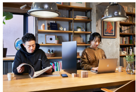
夫婦でダイニングテーブルを共有して働く

本件に関するお問い合わせ先 日建設計 広報室 Tel. 03-5226-3030（代表） e-mail webmaster@nikken.jp