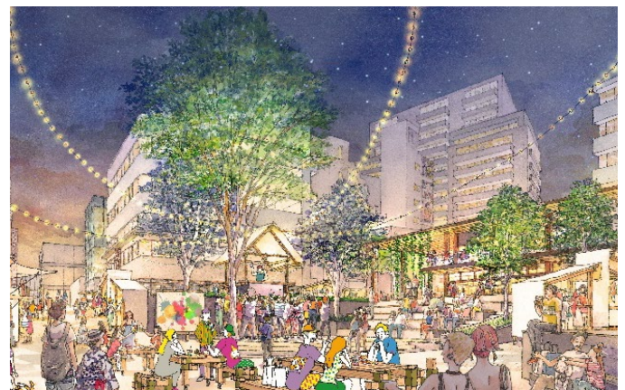
▲オープン後の賑わい創出イメージ※2

北谷公園では、渋谷区の公募により整備事業者として選定された東急を代表企業とする企業コンソーシアムが整備を行い、今般指定管理者に指定された「しぶきたパートナーズ」(URL: https://shibuya-kitaya-park.tokyo/ ) が植栽や公園施設の維持管理を行い、日常的な憩いの場として安全安心な公園環境を提供します。