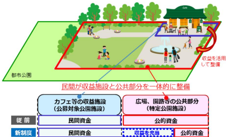
▲Park-PFI 制度のイメージ

2017年の都市公園法改正により創設された、飲食店、売店などの公園利用者の利便の向上に資する公募対象公園施設の設置と、当該施設から生ずる収益を活用してその周辺の園路、広場などの一般の公園利用者が利用できる特定公園施設の整備・改修などを一体的に行う者を、公募により選定する「公募設置管理制度」です。都市公園における民間資金を活用した新たな整備・管理手法として「Park-PFI」(略称:P-PFI)と呼称されています。