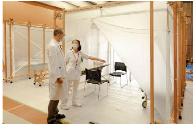
写真：もしもつな木キット