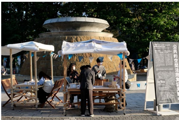
写真：露店型にアレンジしたどこでもつな木

アイデア次第で「つな木」の使い方が広がります。既に様々なところで活躍しています。