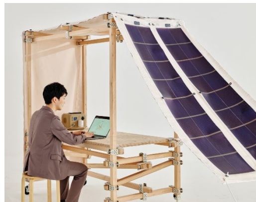
写真：屋外のテレワーク可能な「ソーラーつな木」