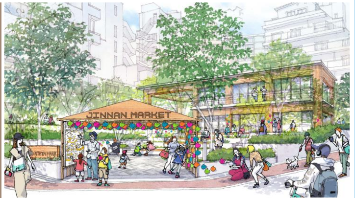
「どんな公園をつくりたい？」ワークショップの様子