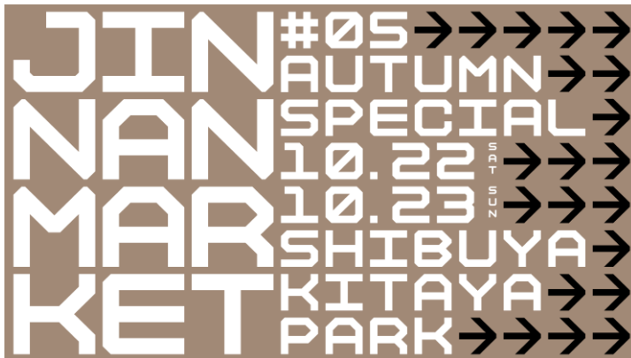
「JINNAN MARKET - Autumn Special -」

株式会社日建設計（本社：東京都千代田区 代表取締役社長：大松敦、以下「日建設計」）が企画運営する「JINNAN MARKET - Autumn Special -」が、10月22日（土）・23日（日）の2日間、神南地域を中心とする11の組織を巻き込んで渋谷区立北谷公園（以下「北谷公園」）にて開催されます。これまで定期的に行ってきた地域連携イベント「JINNAN MARKET」のスペシャル版として、ファッションを中心にシネマ、フード、ミュージック、アート、フィットネス、テックといった7ジャンルのコンテンツを準備するほか、目玉企画として“北谷公園でやりたいこと”で公園を彩る企画「『どんな公園をつくりたい？』ワークショップ」を実施。より多くの人々が、公園を使った新しい体験を楽しめるイベントです。