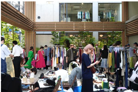
JINNAN MARKET 過去開催の様子

これまで様々なトレンドやカルチャーが生まれてきたファッションと音楽の街・神南エリアから新たにスタートする、地域連携型カルチャーイベントをぜひお楽しみください。