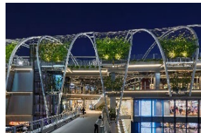
コマーシャルエクスペリエンス （MIYASHITA PARK）