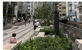
エモーションスケープ （渋谷リバーストリート）

なお、「行動変容コンサルティング」は、日建設計が蓄積した建築・都市の視点からの知見に加え、幅広い分野・領域の知見を結集して展開することが望ましいと考えております。そこで、これまでの日建設計にない専門性を持つ人材など、新たな仲間を求めています。