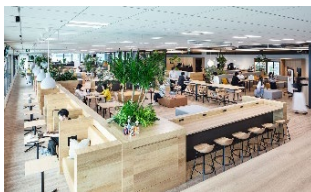
ワークスタイル （取り組み事例）

中期的には「行動変容」を対象としたさらに広い領域に拡張していくことを目指します。