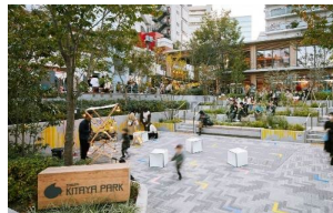
パブリックアセット （渋谷区立北谷公園）